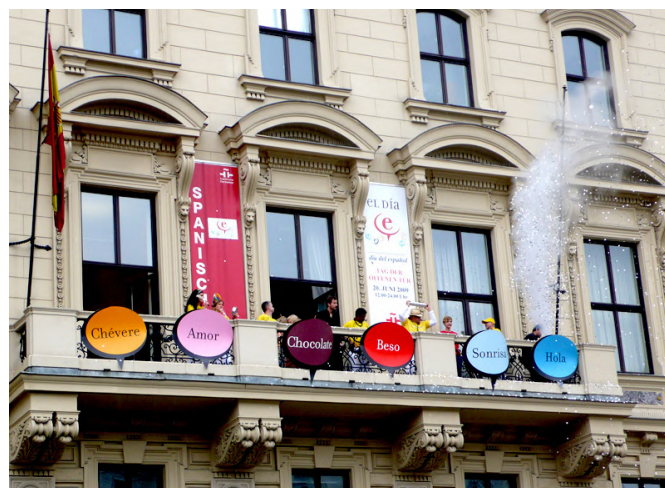
Fachada del Instituto Cervantes de Viena

Por último, destaca también el capítulo de bebidas en el 9º puesto, cuyo crecimiento se desacelera significativamente (+3%).