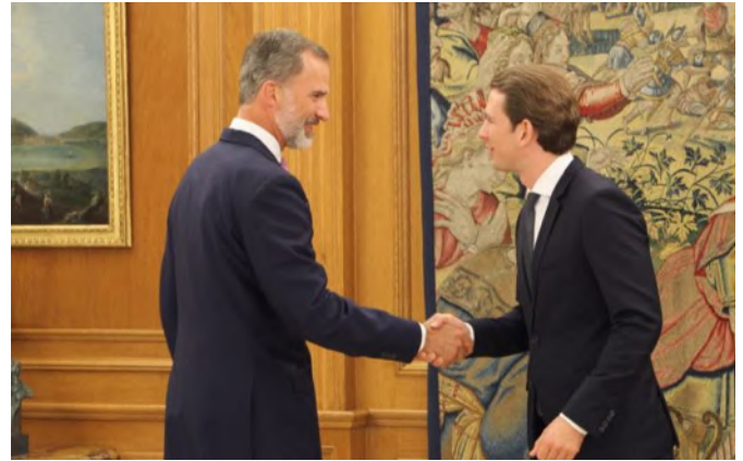
Su Majestad el Rey junto al anterior canciller Federal de la República de Austria, Sr. Sebastian Kurz, con motivo de su visita a España.- Septiembre 2018.-© Casa de SM el Rey

En la actualidad hay aproximadamente 200 empresas austriacas de los sectores productores y comercializadores de bienes de equipo, bienes de consumo y servicios en España. En años recientes, numerosas pequeñas y media-