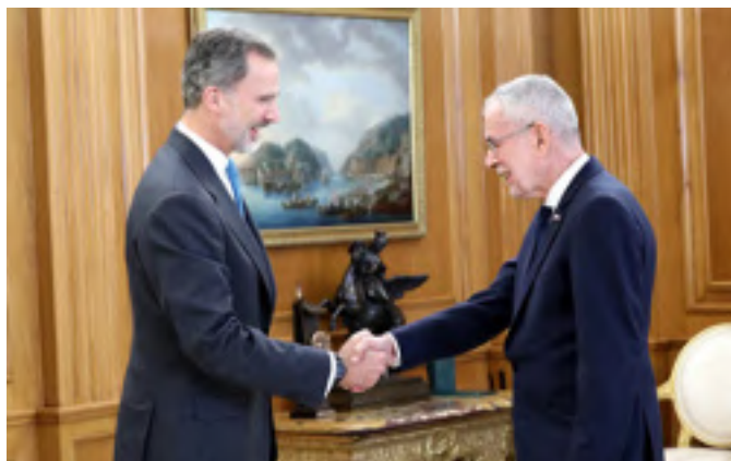
SM El Rey junto al presidente Federal de la República de Austria, Sr. Alexander Van Der Bellen.- Palacio de La Zarzuela. Madrid, 03.12.2019.